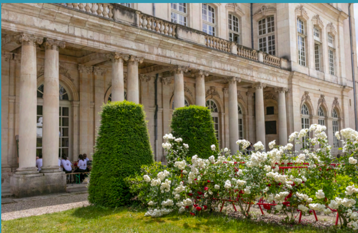
Le Palais du Gouvernement à Nancy, où seront accueillies la plupart des épreuves