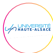
Université de Haute Alsace