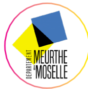
Conseil départemental de Meurthe-et-Moselle