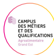
Campus des Métiers et Qualifications Agroalimentaire