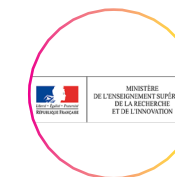
Ministère de l'enseignement supérieur de la recherche et de l'innovation