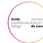
École Nationale Supérieure d'Art et de Design de Nancy