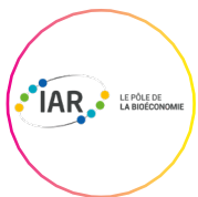
IAR, le pôle de la bioéconomie