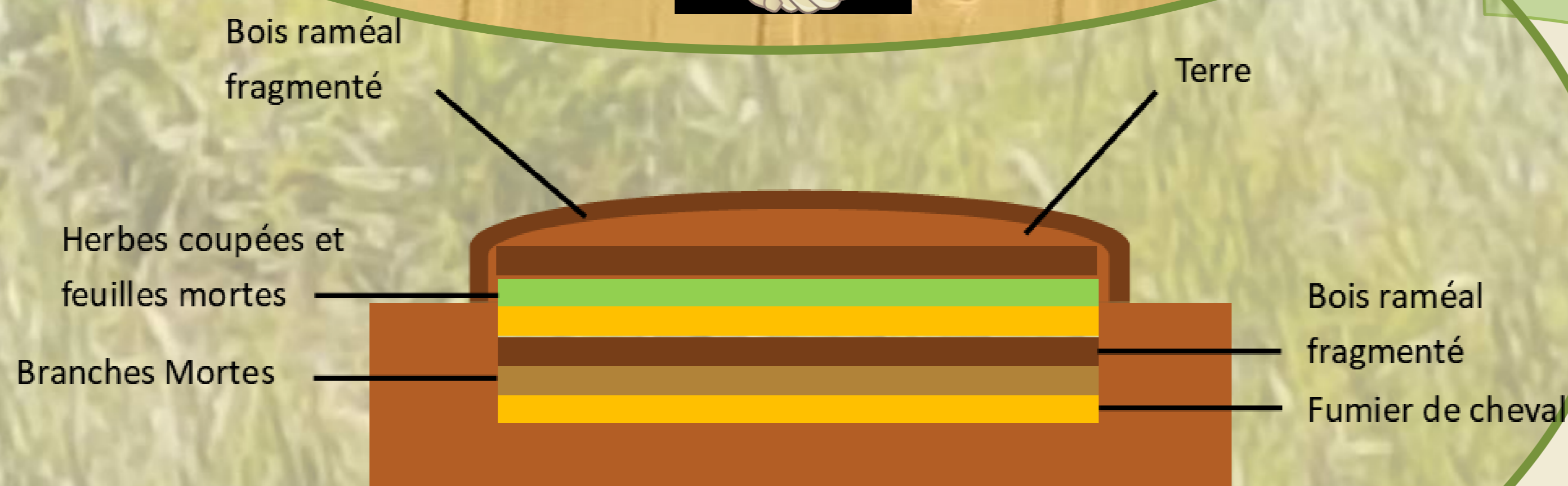
Figure 2 : Butte en lasagne

Les buttes favorisent un milieu riche et une terre meuble ainsi qu'une profondeur de terre plus importante.