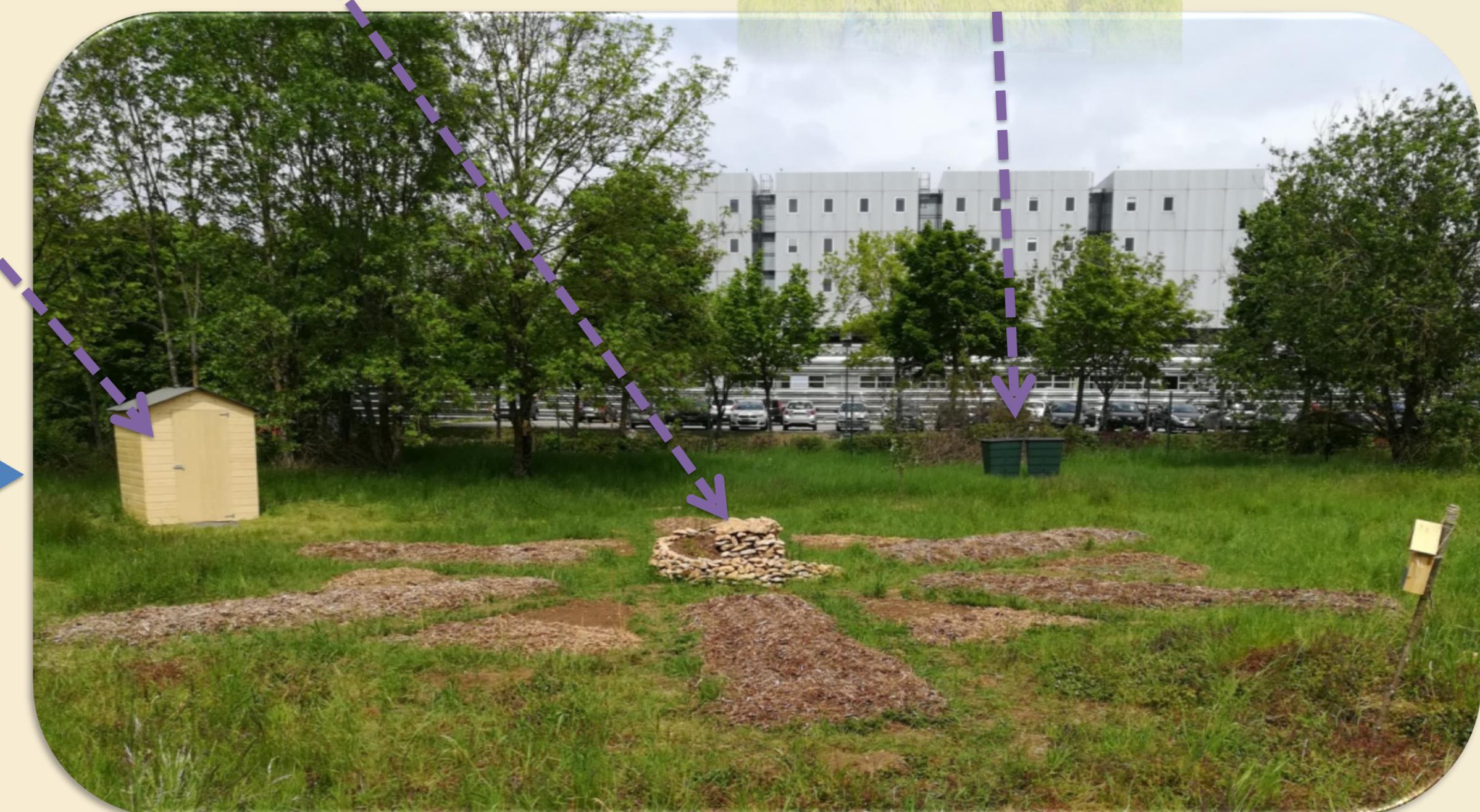
Evolution du jardin au cours du projet

Ce jardin est entièrement intégré à l'association du verger de Brabois. Il sera donc entretenu par les membres de cette association qui pourront profiter des légumes récoltés suivant la charte créée.